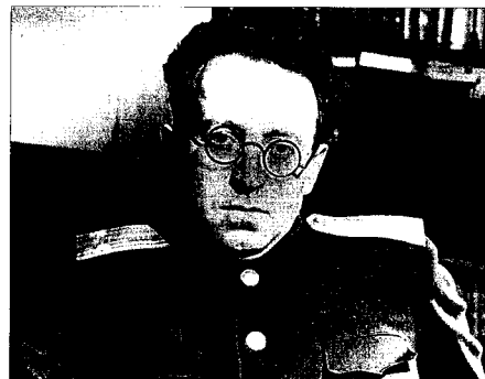
Vasilij Grossman e due immagini della battaglia di Stalingrado

mente a Hitler quando in Unione Sovietica era stato salutato come il «rompighiacco» che avrebbe aperto la strada alla distruzione delle democrazie europee e preparato l'avvento della rivoluzione mondiale). Le parole di Liss nella loro conversazione sono la testimonianza di un tragico passaggio di consegne: «Come potete non riconoscermi in noi, non vedere in noi la vostra stessa volontà? (...) È una sorta di paradosso: se perdiamo la guerra, la vinciamo e ci sviluppiamo in un'altra forma pur conservando la nostra natura. (...) Oggi vi spaventa l'odio che proviamo per gli ebrei, ma domani potreste fare tesoro della nostra esperienza». È l'esperienza del terrore che schiaccia gli uomini tanto nel lager quanto nel gulag per il solo fatto di appartenere a una classe sociale o a un'etnia e perverte molti che chiedono gli occhi o addirittura irraggono profitto dalla lucida irrazionalità dell'ideologia del partito. Ai «commissari del po-